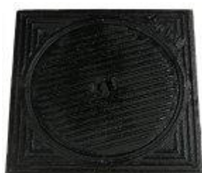
GY deksel dicht