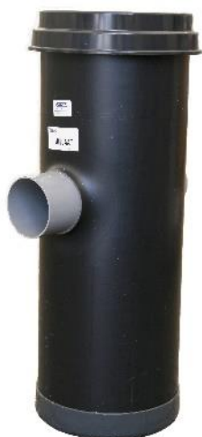
Zandvangput met kunststof deksel