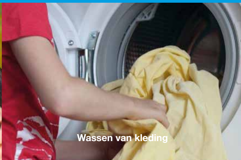
Wassen van kleding