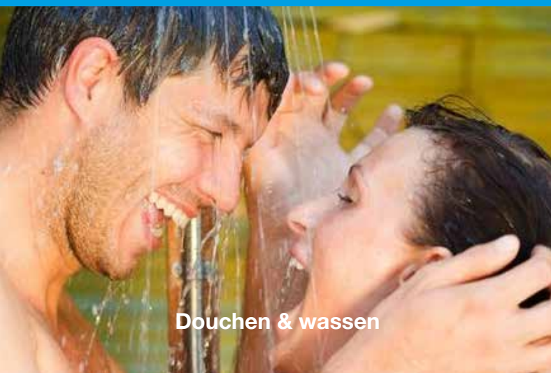
Douchen & wassen

Regenwater is erg geschikt om je er mee te wassen of te douchen. Een systeem met membraanfilter zorgt voor het zuiverste water, vrij van alle bacteriën en virussen. Wat er overblijft is schoon, gratis en heerlijk zacht water. U kunt 95% op uw drinkwater besparen als u regenwater gebruikt voor: