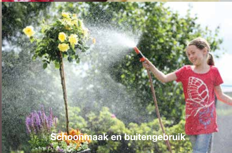
Schoonmaak en buitengebruik