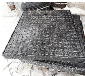
Gietijzeren deksel B125kN