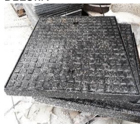
Gietijzeren deksel B125kN