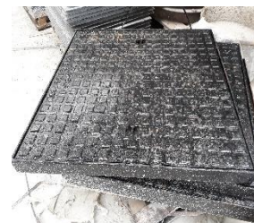
Gietijzeren deksel B125kN