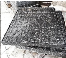
Gietijzeren deksel B125kN