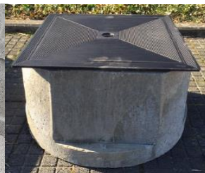
Gietijzeren deksel A15kN