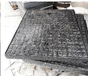
Gietijzeren deksel B125kN