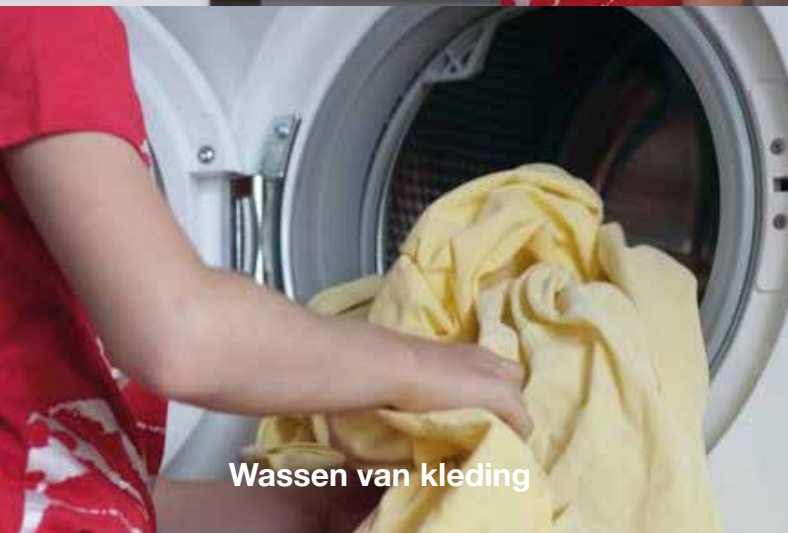
Wassen van kleding